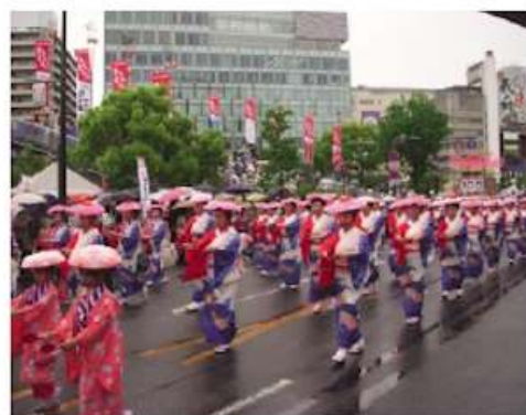
「ばんちかわいや寝んねしな...」の歌声としゃもじの音色が響く明治通り。今年も雨のどんたくでした。(5月4日)