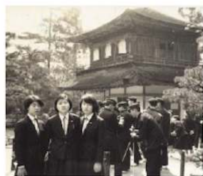
初代制服、着用は20回生

女子生徒の移籍入校により、女性教師と生徒の考案によるスーツが制服として採用されました。男子生徒の帽子の替わりに、襟章の着用が決定。このデザインはラグビーボールをかたどったもので、女子生徒から提案されたものだそうです。初代制服は1949年以降、およそ半世紀愛用されてきました。1994年に女子制服は2代目に、そして2005年度入学の女子夏服、2006年度入学の男女冬服が変更されました。男子制服は初めての、女子制服は2度目の変更です。