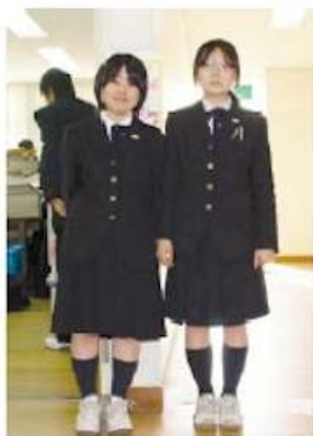
現役福高生です。初代制服同様のシングルスリーブになりました