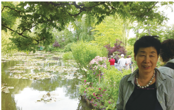
マテララの洞窟B&Bとレンタカー

若葉マークが取れない内に米西海岸でレンタカーによる一人旅をして味を占め、以来海外旅行も車です。出光石油のCMで憧れた南仏の雲の中に浮かぶミヨウ大橋やラスコーの洞窟等、行きたいところへ思いのままに動きますが、ちょいちょいトラブルも。