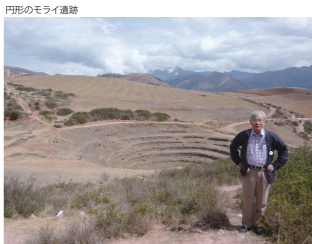
円形のモライ遺跡

トレッキングは、クスコから82km地点からマチュピチュのかつての正門インティンカ「太陽の門」まで43km、インカ古道の石段や石畳の道を3泊4日で歩きました。特に2日目は、標高4200mの峠まで高度差1200mの急登で、高齢の身にはかなりしんどかったです。氷雪のアンデスの山々(世界百名山サルカンタヤ山6271m)なども眺望できました。山中のテント泊では、南半球の綺麗な星空が見れました。ランヤプロメリアなどの植物、ハチドリなどの小鳥との出会いもあり