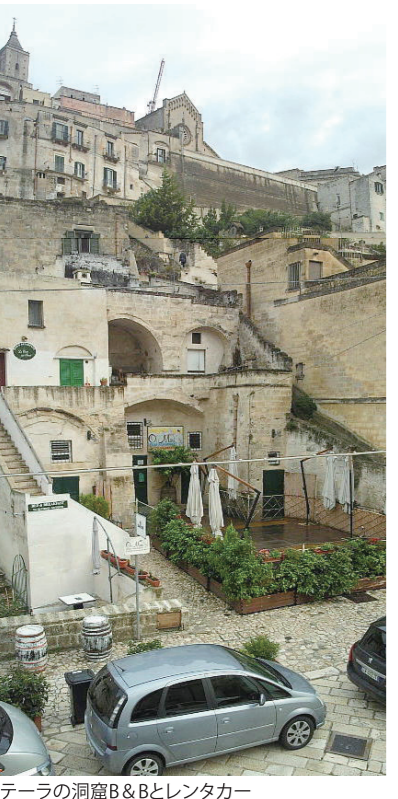
マテララの洞窟B&Bとレンタカー