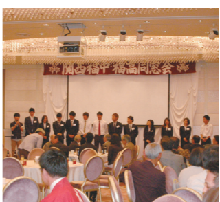
総会で現役大学生が登壇