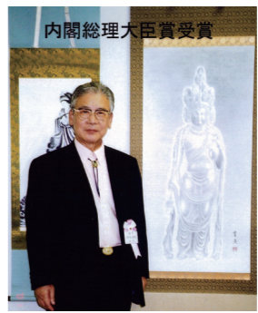
内閣総理大臣賞受賞(2001年)

受け止めて描きさえすれば良いのではないかと思いつくまで、随分と時間を費やした。自分の意志を主張して描くのではなく、唯ひたすらに仏像の「お力」によって描くのだという素直な心境になつてはじめて、仏像が自分なりに写仏となり、絵画的に美しい水墨画になってきたのです。それそれの仏像は長い年月の間に色々な垢を受け、塗料が剥げ落ちた姿となつていますが、せめて絵の上では手直しして美しく明るくなるように表現しました。