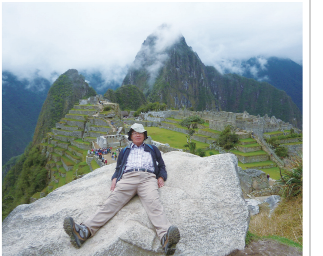
マチュピチュ ワイナピチュ峰

今までに、ニージーランド、ヨーロッパ、南米ペルーの「インカトレイルトレッキング」に行きました。大阪から丸1日以上かけて標高3400mのインカの古都クスコに着き、世界遺産登録のクスコ市内を観光後、高所順応を兼ねて「イン