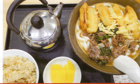
うどん 釜揚げ 牧のうどん