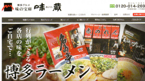
通販サイト 博多グルメ味の宝庫 味蔵