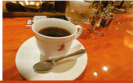
コーヒー 珈琲舎のだ

幼稚園時代から通っているうどん屋。博多駅バスターミナル内なので帰省時福岡出張時によく寄ります。ご存じ食べても食べてもうどんが減らない。逆にスープが極端に減るのでスープをやかんでつぎ足します。肉うどんにごぼ天トッピング、ねぎも投入、プラスかしわ飯で決まり!